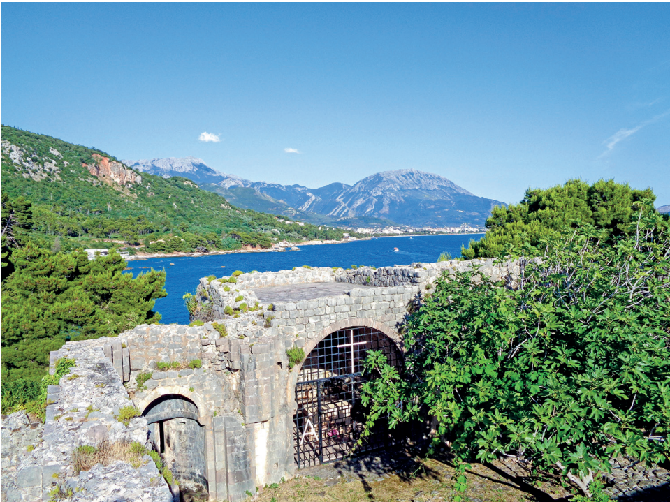
Die Abtei von Ratac an der Küste von Montenegro untersuchten die Forschenden genauer. Sie wurde im 9. Jahrhundert als Benediktinerabtei gegründet, erlebte eine Blütezeit im 14. Jahrhundert und wurde schließlich im 16. Jahrhundert von den Osmanen zerstört

und Karten, sammeln geografische Daten per Drohnenaufnahmen und Satellitenbildern und verstetigen die Kenntnisse auf Feldforschungsreisen. Die Deutsche Forschungsgemeinschaft (DFG) und der österreichische Wissenschaftsfonds (FWF) fördern das internationale Projekt bis Herbst 2023. „Die Zone stand bisher kaum im Mittelpunkt der Forschung, weder von der östlichen noch von der westlichen Seite. Wir wollen die Kirchen und Klöster vom 11. bis ins frühe 14. Jahrhundert genauer bestimmen und die herausragende Rolle dieser Gegend als Schmelztiegel der Religionen und als Pufferzone zwischen dem Byzantinischen Reich und dem lateinischen Westen hervorheben“, erläutert Tripps.