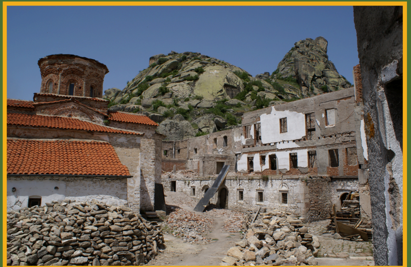
Das Kloster Treskavec nach einer Feuersbrunst im Jahre 2016

Die Historische Geographie unterstützt mit ihren Forschungsprojekten und Gelände-erkundungen (Surveys) den Denkmalschutz und bietet wichtige Grundlagen für lokale Behörden und politische Entscheidungsträger.