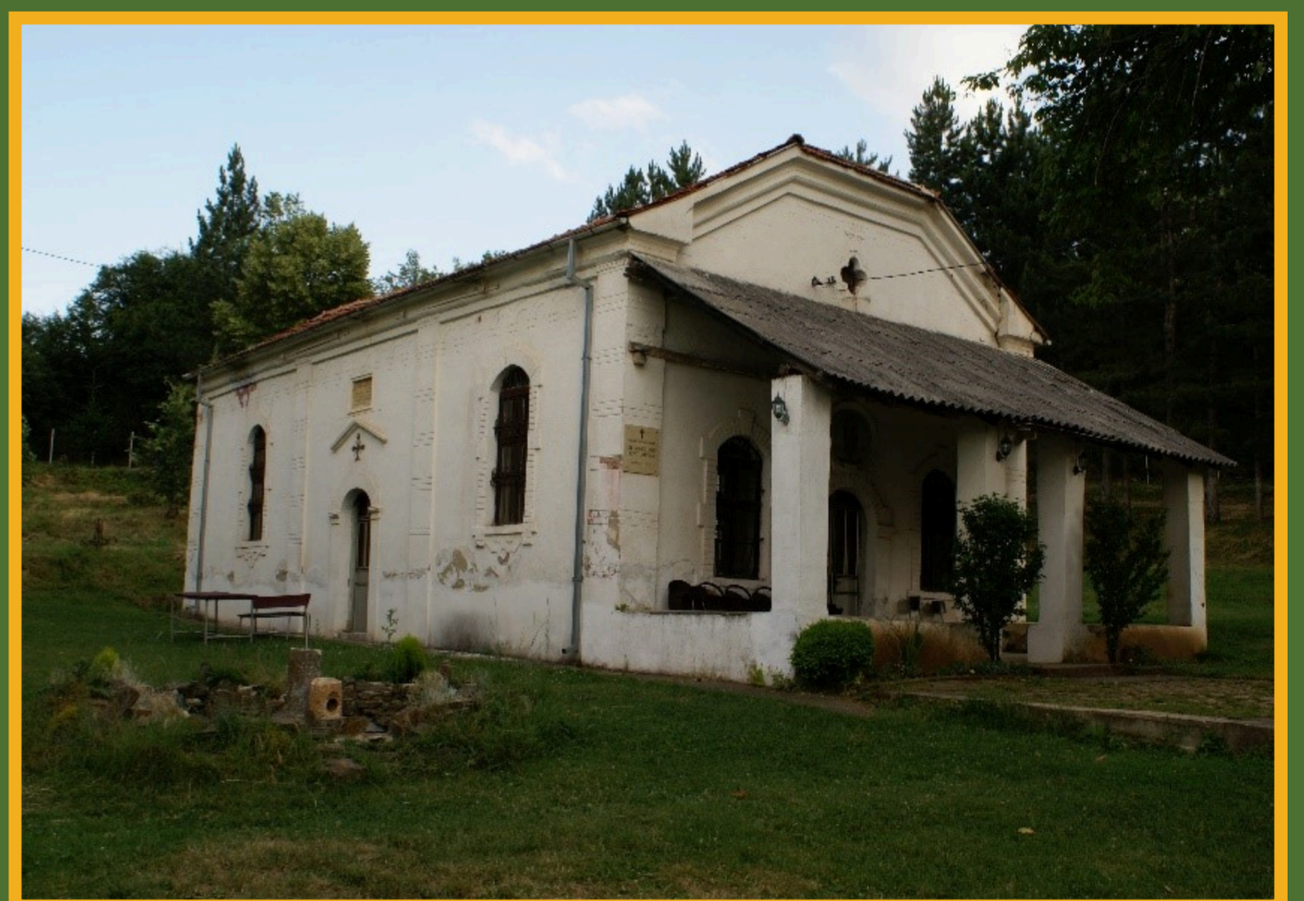
Dieselbe originalgetreu wiedererrichtete Kirche im Jahre 2016

Kulturdenkmäler sind Geschichtszeugnisse mit Erinnerungswert für eine Gemeinde oder ein ganzes Land. Sie dokumentieren unsere vielfältige menschliche Geschichte und Entwicklung. Sie prägen bis heute unsere Umgebung und regen zur Auseinandersetzung mit unserer Vergangenheit an.