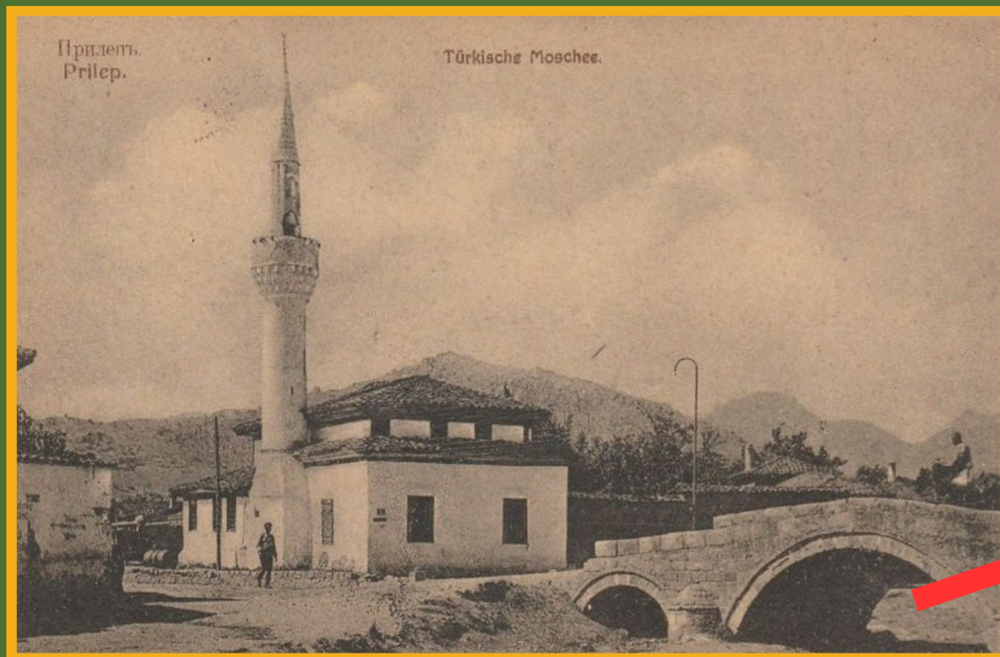
Die osmanische "Weiße Moschee" und die Brücke "Kjemerlija" in Prilep im Ersten Weltkrieg

In unserem Projekt erforschen wir in Zusammenarbeit mit der Universität Skopje die mittelalterlichen und neuzeitlichen Denkmäler auf der südlichen Balkanhalbinsel während des Ersten Weltkriegs und insbesondere die Regionen Prilep-Bitola und Mariovo hinter der sogenannten Salonikifront in der jetzigen Republik Nordmazedonien.