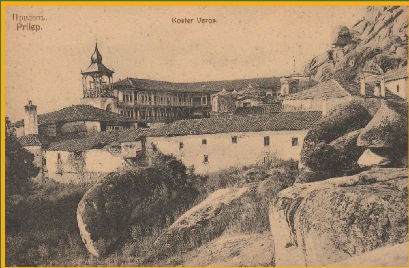
Das mittelalterliche Kloster Treskavec im Ersten Weltkrieg

Die Byzantinistik befasst sich mit der Geschichte, der Literatur und Sprache, der Religion sowie allen weiteren Aspekten der Kultur des Oströmischen (Byzantinischen) Reichs vom 4. bis zum 15. Jahrhundert. Ein wichtiger Teil davon ist die Historische Geographie des byzantinischen Raums und die Erforschung seiner Denkmäler (hier am Beispiel Nordmazedoniens).