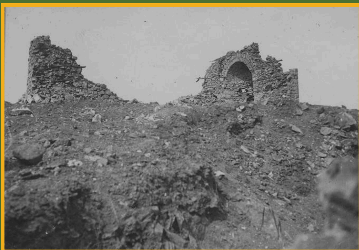
Die neuzeitliche Kirche Sveti Hristofor im Dorf Krstoar im Jahre 1916/17

Die Historische Geographie unterstützt mit ihren Forschungsprojekten und Gelände-erkundungen (Surveys) den Denkmalschutz und bietet wichtige Grundlagen für lokale Behörden und politische Entscheidungsträger.